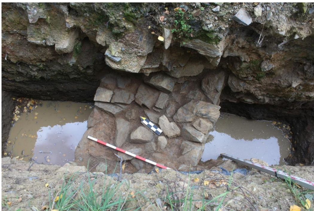
Úsilov – odkrytá obvodová hradba tvrze v sondě 1/25

Sonda 2/25 směřovala od tvrze k SV a podařilo se v ní dokumentovat jednotlivé zásypové vrstvy příkopu až po jílovité sedimenty na jeho dně. V nejvýchodnější části sondy pak byly zachyceny mocné destrukční vrstvy, které obsahovaly značné množství nálezů (především renesanční komorové kachle, zlomky malovaného renesančního dutého skla, kuchyňskou a stolní keramiku, prejzy a cihly). Mocné destrukční souvrství je zřejmě nepřímým dokladem existence z ikonografie známé průjezdní budovy, která se zhruba v těchto místech nacházela, přímo však prozatím zachycena nebyla. Významným zjištěním byl nepočtený soubor keramiky z nejspodnější štěrkovité vrstvy, kterou lze datovat do 13. století, ojediněle se zde vyskytovala ale i keramika pravěká (zatím bez bližší datace).