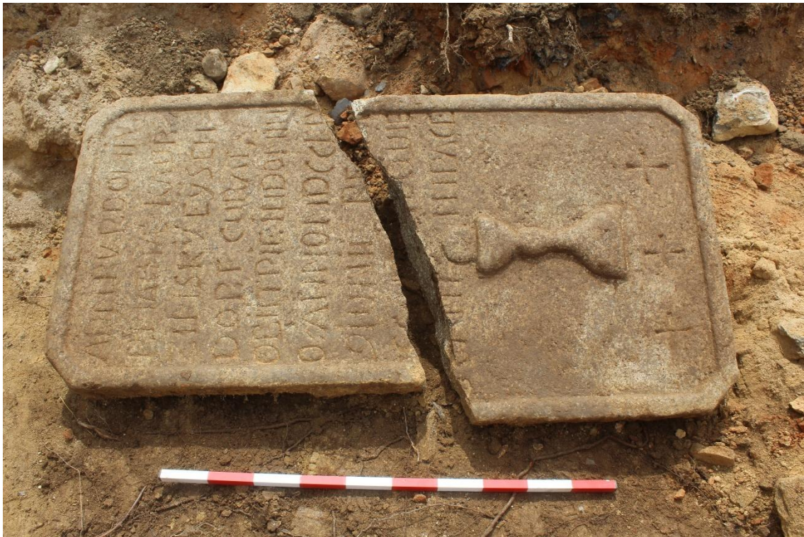
Železná – jeden z náhrobníků nalezený v destrukci zaniklého kostela