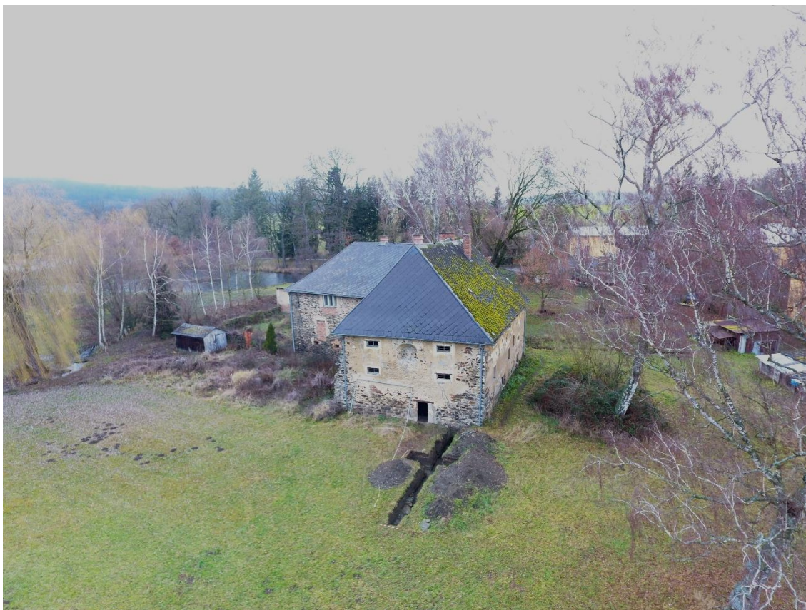
Úsilov – celkový pohled od jihovýchodu, v popředí sonda č. 3/25

konstrukce byla poškozena pozdějšími zásahy (zazdívkou, odvodňovacím kanálem a recentní drenáží). Kamennou zeď se špaletou prozatím interpretujeme jako obvodovou hradbu středověké tvrze. Otázkou je účel špalety (vstupu) v této části dispozice, která navíc byla pravděpodobně během novověku zazděna subtilní kamennou zídkou.