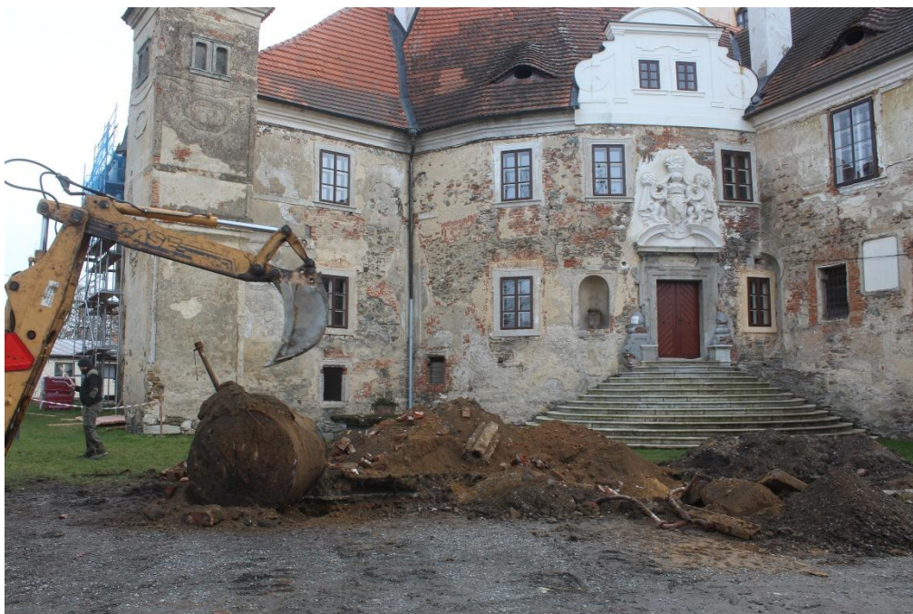
Poběžovice – jeden z vyjmutých naftových zásobníků v prostoru před hlavním zámeckým vstupem