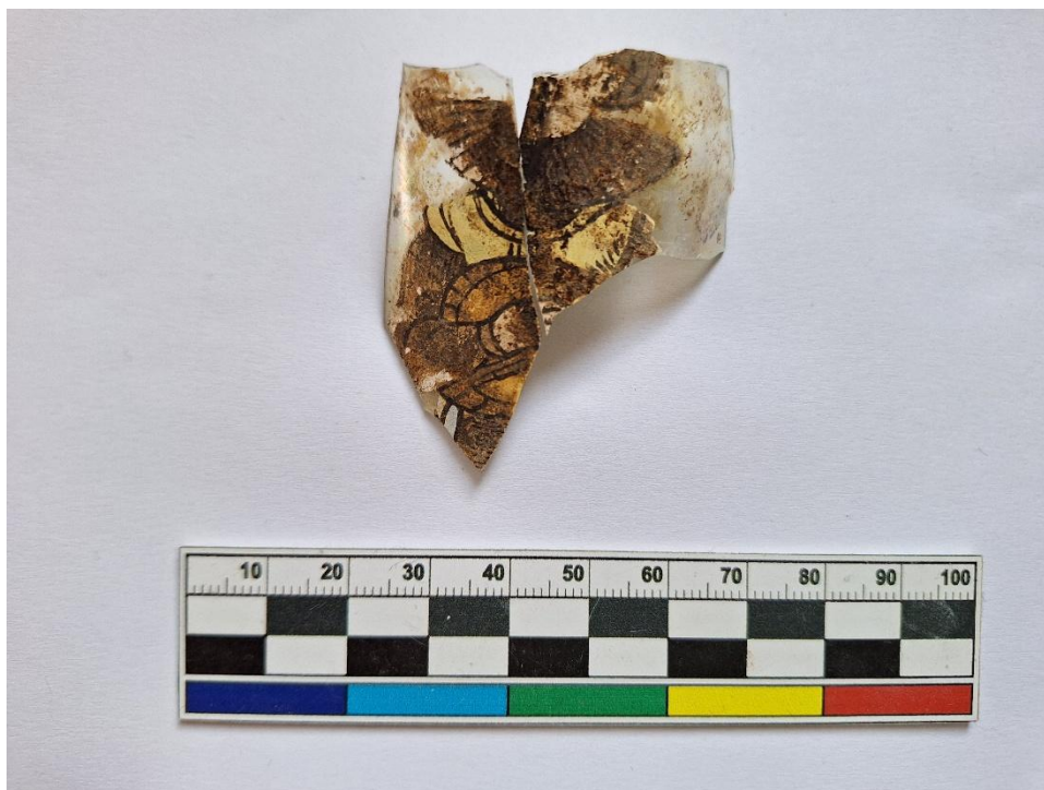
Úsilov – zlomek skleněné malované renesanční číše ze sondy č. 2/25