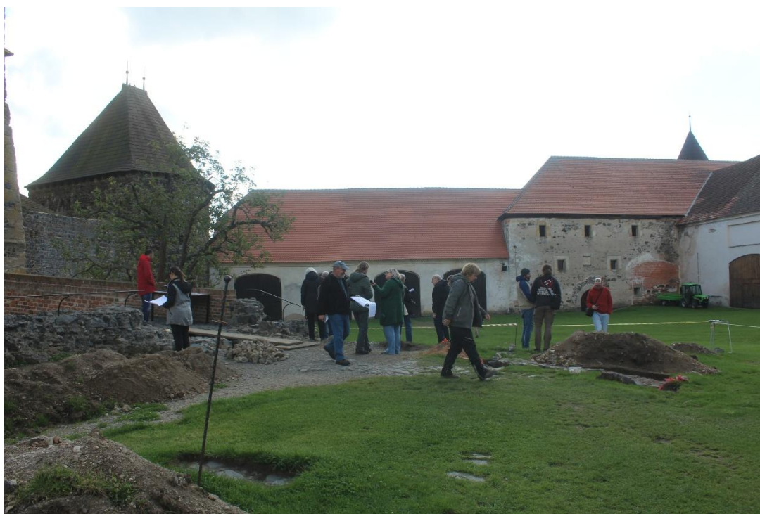
Archeologická komise na hradě Švihov

Archeologická komise při výzkumu předpolí branské věže hradu Švihova – 30. 9. 2025 (PK+TM)