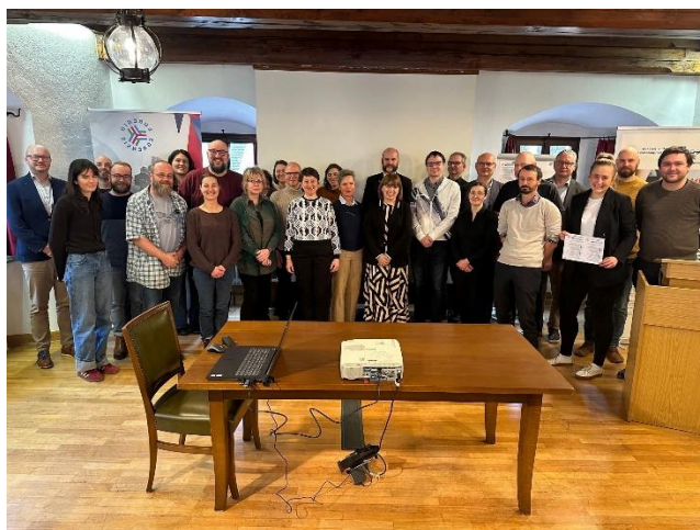
Prosinec -setkání českých a německých muzeí v přeshraničním regionu – Weiden

Opakovaně monitorovací cesty v regionu a cesty na přírodovědné akce, které muzeum pořádá v regionu okresu Tachov (viz příslušná kapitola VZ).