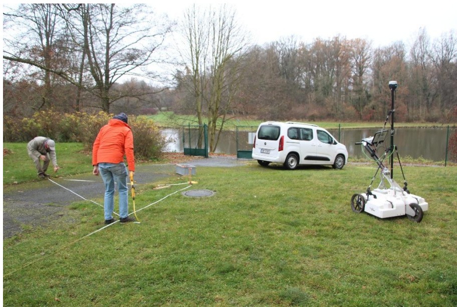
Geofyzikální průzkum na zámku v Boru u Tachova (průzkum proveden pracovníky z Masarykovy univerzity)