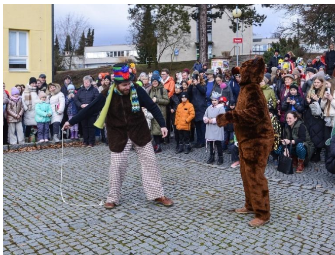
Masopust 2025 – budoucí ředitel muzea v roli aktivního vystupujícího

Návštěvníci akcí v zahradě dosáhli počtu 1771 (některé akce spolupořádáme, pro některé půjčujeme prostor a vybavení jiným neziskovým subjektům). Volná návštěvnost klášterní zahrady je 400 osob (jde o kvalifikovaný odhad). I volné návštěvy muzejní zahrady narostly. To jistě souviselo s tím, že se podařilo pronajmout sezónní bistro, které poskytlo drobné občerstvení a zároveň nájemkyně pořádala řadu akcí pro rodiče s malými dětmi.