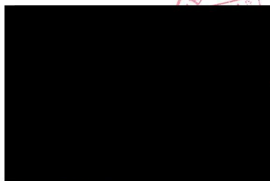
Martin Záhoř náměstek hejtmana pro oblast sociálních věcí