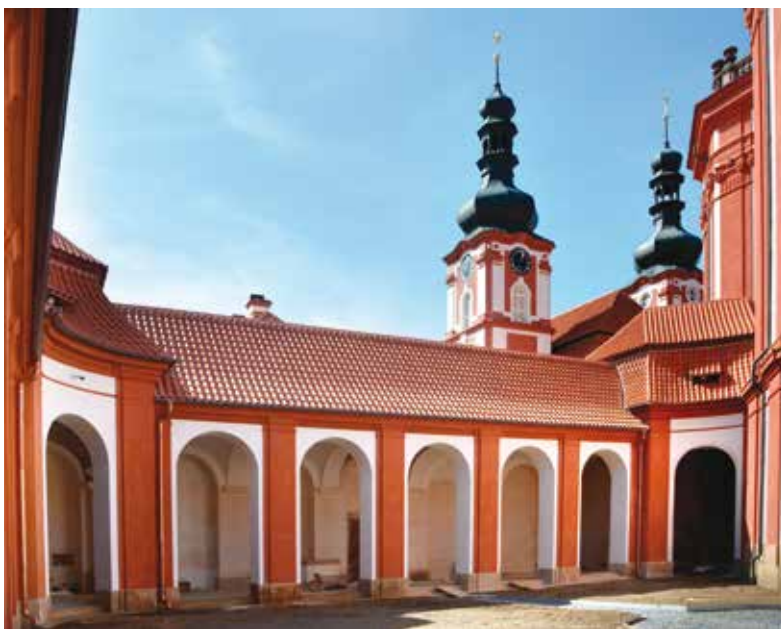
Dostavěná část areálu Mariánské Týnice

kteří tyto náročné projekty realizují, protože tím přispívají nejen k dalším nabídkám pro své návštěvníky, ale především díky dosaženým dotacím šetří finanční prostředky Plzeňského kraje, které tak mohou být vynaloženy na další důležité potřeby našich občanů. Celková částka ve výši 378,4 milionu Kč, kterou bychom měli získat od Evropské unie na výše uvedené akce, rozhodně není při celkovém objemu nákladů ve výši 481,5 milionu zanedbatelná. Chci věřit, že takto úspěšní budeme i v budoucnu,“ uzavírá Marek Ženíšek.