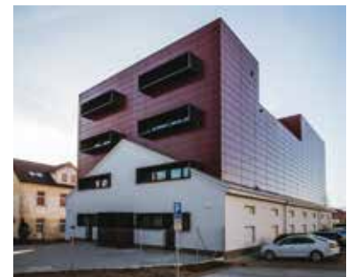
Rekonstrukce depozitáře Studijní a vědecké knihovny, stav před zahájením stavby a aktuální stav

kteří tyto náročné projekty realizují, protože tím přispívají nejen k dalším nabídkám pro své návštěvníky, ale především díky dosaženým dotacím šetří finanční prostředky Plzeňského kraje, které tak mohou být vynaloženy na další důležité potřeby našich občanů. Celková částka ve výši 378,4 milionu Kč, kterou bychom měli získat od Evropské unie na výše uvedené akce, rozhodně není při celkovém objemu nákladů ve výši 481,5 milionu zanedbatelná. Chci věřit, že takto úspěšní budeme i v budoucnu,“ uzavírá Marek Ženíšek.