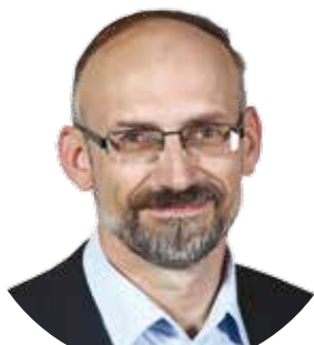
Pavel ČÍŽEK (STAROSTOVÉ A PATRIOTI) náměstek hejtmána pro oblast dopravy