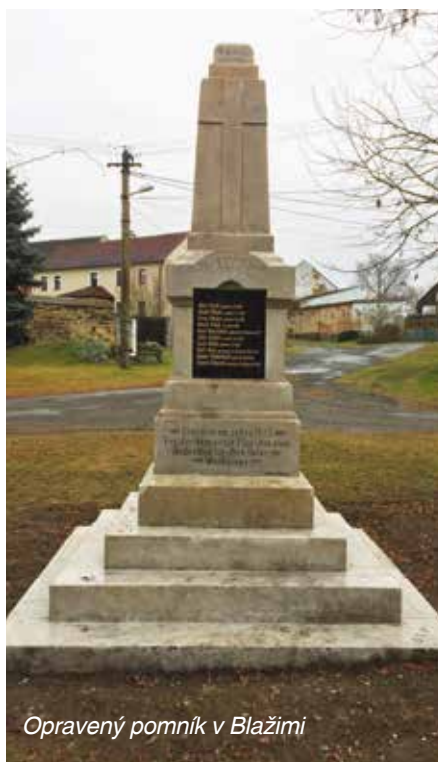
Opravený pomník v Blažimi