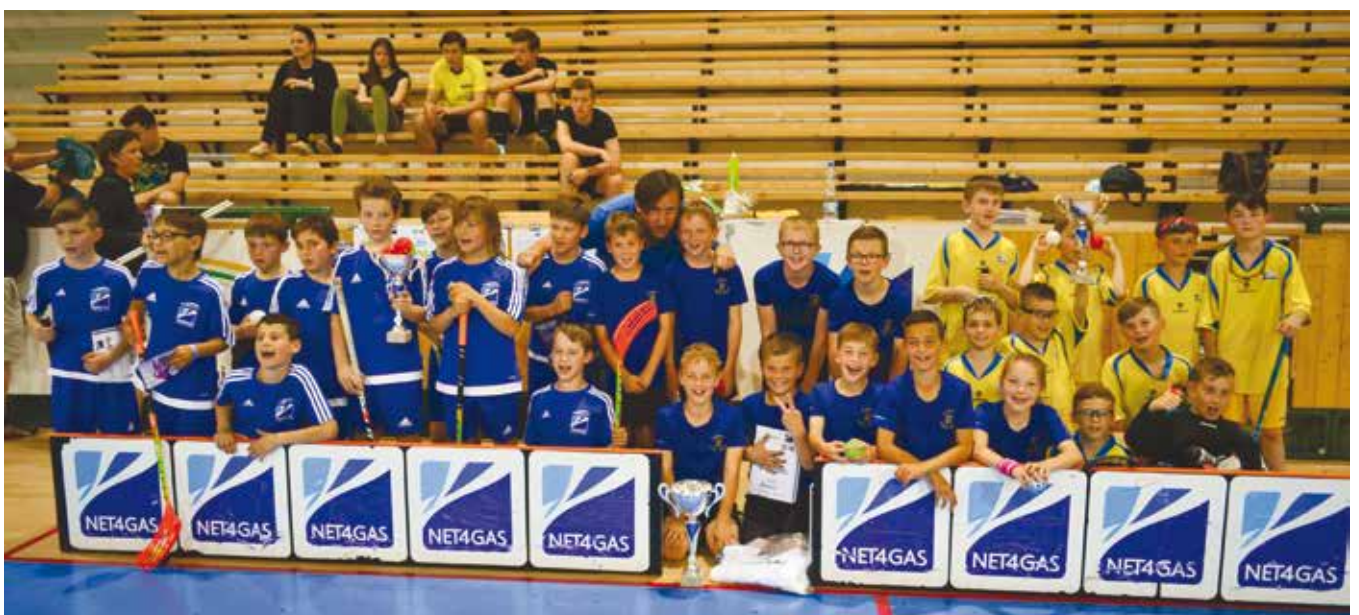
Dne 23. května 2017 se uskutečnil v plzeňské hale TJ Lokomotiva již 4. ročník turnaje „O pohár hejtmana“ ve florbalu dětí ve věku do 9 let. Turnaje se zúčastnilo 260 dětí z celého Plzeňského kraje. Vítězem se stal tým ze Švihova.

Pavel Strolený (ANO) zastupitel Plzeňského kraje