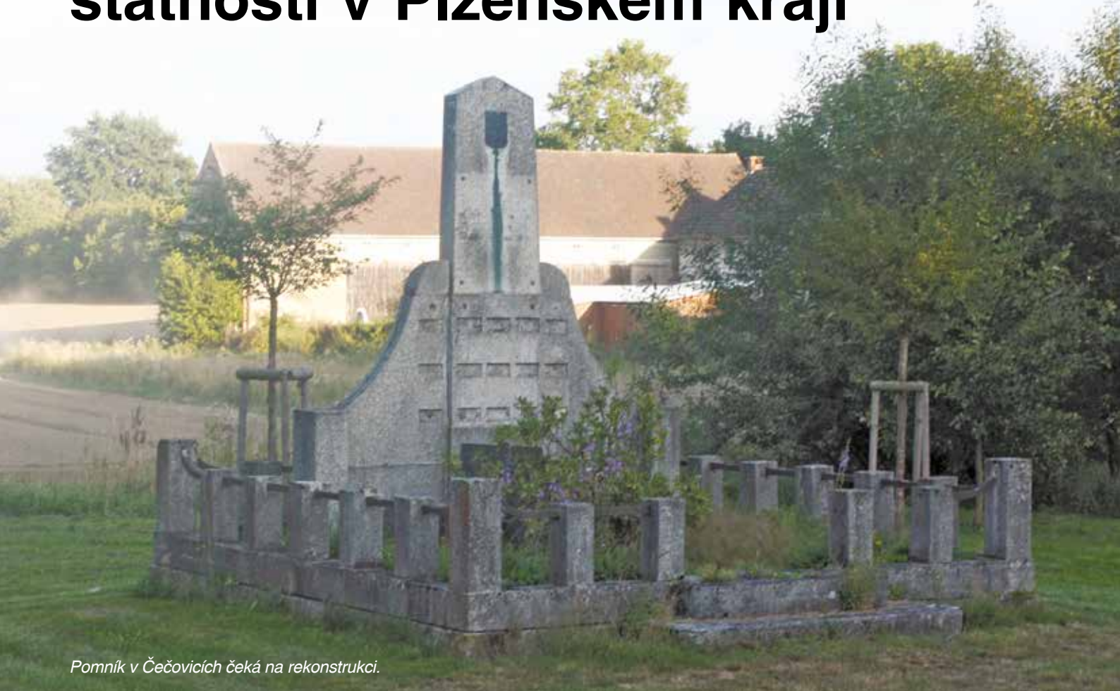
Pomník v Čečovicích čeká na rekonstrukci.

Na většině návsi v obcích Plzeňského kraje najdeme pomníky, které nám mají připomínat události světových válek. Válečným hrobem či pietním místem jsou ale i místa, ve kterých jsou uloženy ostatky osob, které zahynuly v průběhu válečných událostí. Úplnou definici pojmu upravuje příslušný zákon.